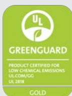
Сертификат UL GREENGUARD GOLD 11

Компания HP осуществляет внедрение комплексной защиты окружающей среды в широкоформатную печать. Принтер HP Latex 560 получил сертификат EPEAT Bronze в знак пониженного воздействия на окружающую среду. 12