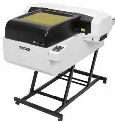
НОВИНКА - ValueJet 626UF

На выставке FESPA 2017 компания MUTON представляет планшетный УФ-принтер Mutoh ValueJet 626UF формата A2 со светодиодной лампой и 2 сублимационных принтера