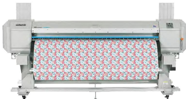
НОВИНКА - ValueJet 1948WX

г.Оостенде, Бельгия. Производитель широкоформатных принтеров компания MUTON представит на своем стенде (холл А1, №А15) на выставке FESPA 2017 (г.Гамбург, Германия) обширное портфолио профессиональных широкоформатных принтеров.